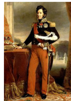
Louis Philippe Ier