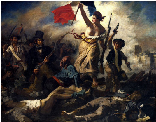
Tableau de Eugène Delacroix peint en 1830, La liberté guidant le peuple .