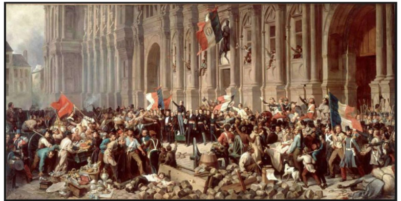
Tableau de Henri-Félix-Emanuel Philippoteaux peint en 1848, Lamartine repoussant le drapeau rouge à l'hotel de ville, le 25 février 1848

Ces 2 tableaux décrivent des événements. Relève leur date et indique de quel type d'événements s'agit-il ?